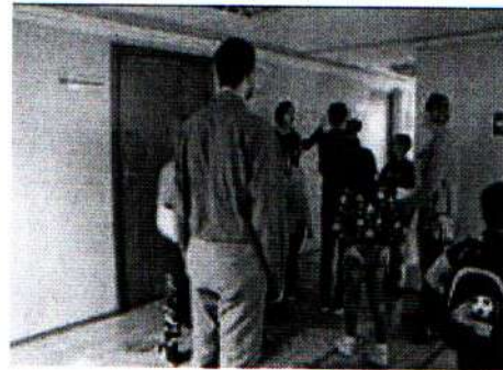
Занятие в музее Алабина 07.06.18