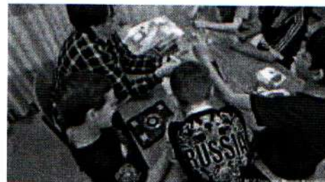
Занятие мультипликацией 26.11.18