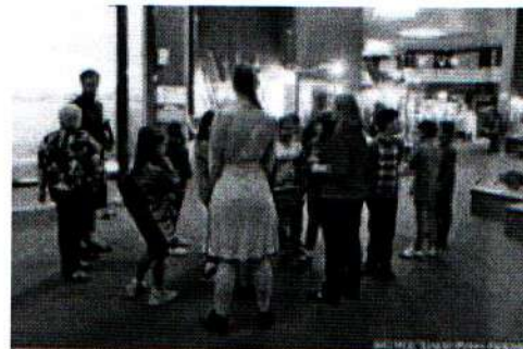
Музей Алабина 20.09.18