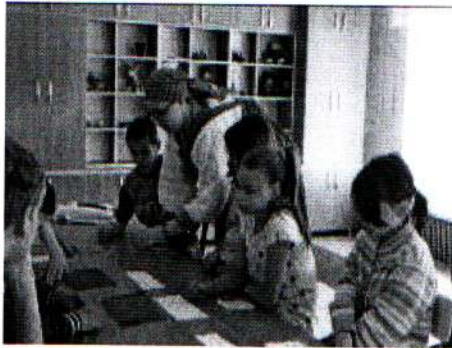
Занятие ДТП 26.05.18