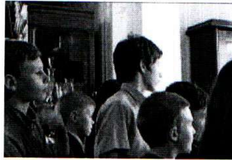
Занятие в музее Толстого 07.05.18