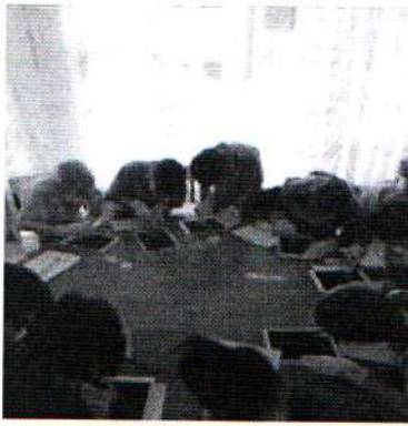
Игра Реставратор 26.03.18