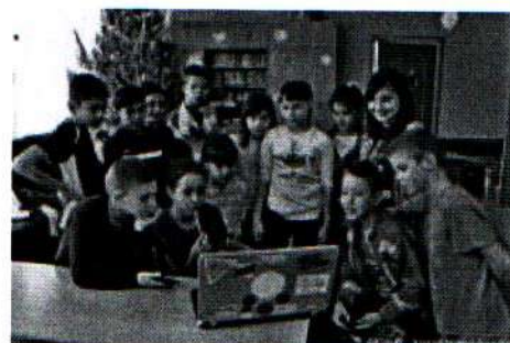
Дети смотрят снятый мультфильм 29.12.18