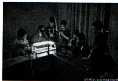
Занятие мультипликацией 06.12.18