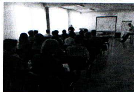
Семинар по практике проекта 30.01.19