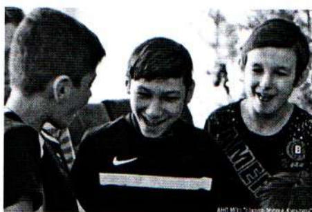
Дети смотрят снятый мультфильм 29.12.18