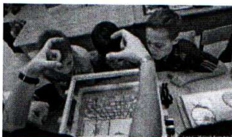
Занятие мультипликацией 08.10.18