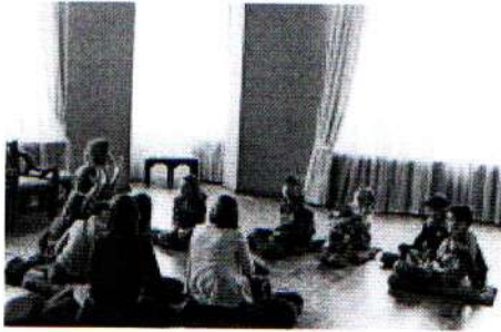
Занятие в музее модерна 31.03.18