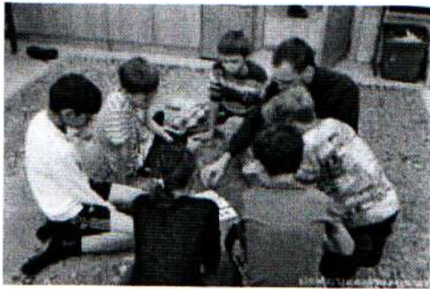
Игра Китайская коллекция 29.10.18