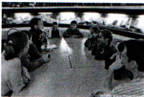
Музей Алабина 20.09.18