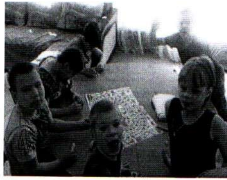
Игра Экскурсовод 30.04.18