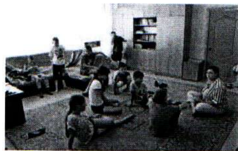
Первое занятие мультипликацией 03.09.18