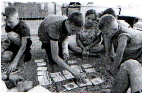
Игра Меценат 03.09.18